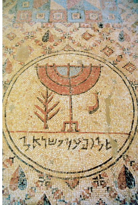
Mosaïque de la synagogue de Jéricho (Ve siècle)